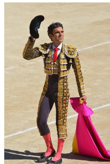
Photos : Jilguero, toro de Saltillo déboulant du toril de Céret le 15/7/2017 ; Andres Roca Rey effectuant un pendule à genoux devant un toro de Jandilla à Séville le 19/4/2018 ; Jose Tomas lors de son triomphe en seul contre 6 à Nîmes le 16/9/2012.